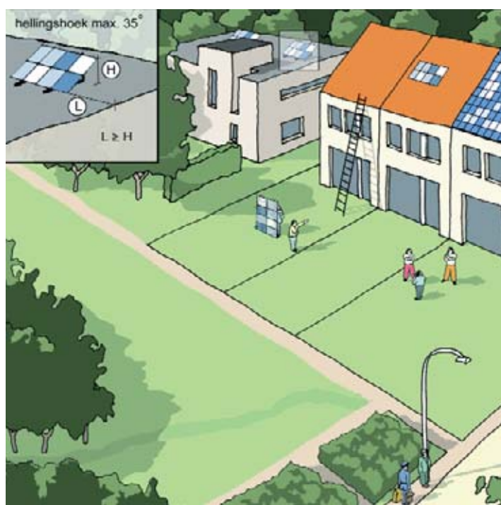
In dit geval mag u een zonnepaneel of collector zonder bouwvergunning plaatsen.